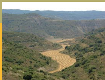
Vales y Montes de Castejón desde el itinerario