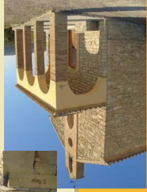
Ermita de Santa Ana