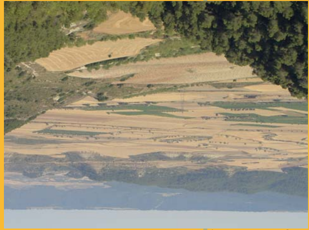
Vista panorámica desde El Abbejar

Al norte de la localidad de Valdejasa de Castejón de Valdejasa se levanta la Sierra de Sora, un paraje natural poblado de pinares y numerosas especies vegetales. Este extenso territorio jalonado de vales rodeadas por plataformas de época terciaria, permanece escondido, desconocido para el visitante. Sin embargo, encierra multitud de atractivos naturales y del patrimonio cultural del municipio. La senda del Abbejar se trata de un camino recuperado para el senderismo, un bonito y fácil paseo entre los pinares de la Sierra de Sora y Montes de Castejón. El Abbejar se halla localizado a media ladera entre el pinar, desde el que se observa una magnífica panorámica de la Depresión de Tuste y del Barranco del Plano. Es una de esas construcciones dispersas