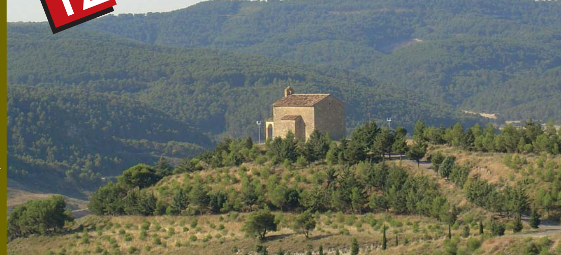
Realiza: P. RAMÉS • Fotos: J. Romeo y J. Folgar © Archivo P. Ramés