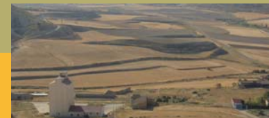
Campos de cultivo en la Val de Zaragoza