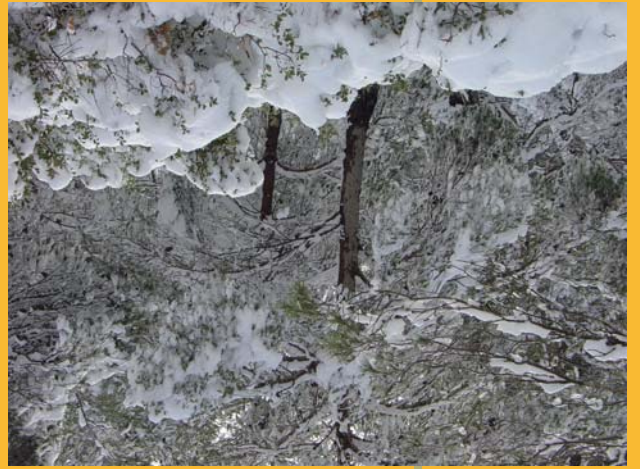
Nevada sobre la Val de Castellar

Por la ruta del Barranco o Val de Valdecarro podemos observar numerosas formas de relieve ligadas a este sector semiárido del centro de la Depresión del Ebro. La ruta –se recomienda realizarla en bicicleta de montaña y evitar la estación