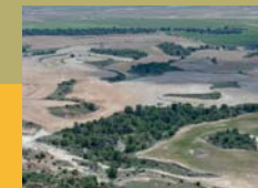
Vista desde Sora

Descárgate la ruta o el track para tu GPS: www.comarcasincero-las.es