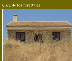
Casa de los forestales