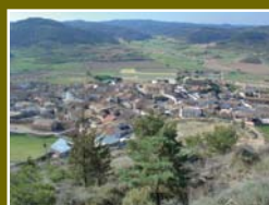
Castejón de Valdejasa. Al fondo la Val de Castellar