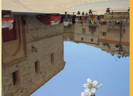
Plaza e iglesia parroquial de Castejón