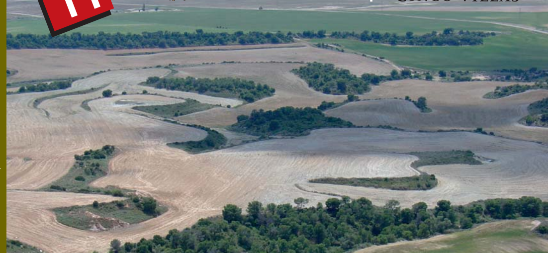
Realiza: PRAMES.